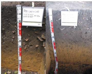
Foto 1. Perfis de Terra Preta de Índio em Iranduba, Amazonas - Brasil

Foi selecionado um solo de textura arenosa e outro de textura argilosa, no qual foram coletados em sítios de TPI nas localidades da Costa do Açutuba e Caldeirão, ambas no município de Iranduba – Brasil. Amostras de solo foram misturadas com fragmentos cerâmicos selecionados em tamanhos de 8 e 4 mm e posteriormente colocados em cilindros metálicos. Para avaliar a capacidade de retenção de água utilizou-se a curva de retenção como parâmetro de inferência desses valores. As amostras foram saturadas e então sucessivamente submetidas a sucção de 1,5 e 1,8 pF em mesa de tensão e posterior pressão de 3,0 pF em panela de pressão.